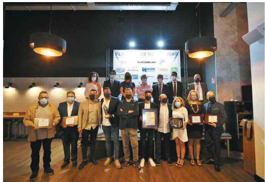
Foto conjunta de los protagonistas de la gran noche de la hostelería de Torrevejeja.