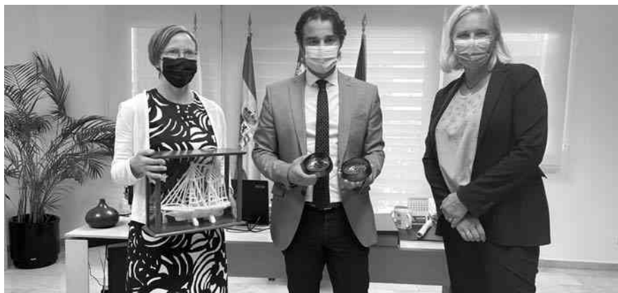
El alcalde, Eduardo Dolón, y la concejal de Residentes Internacionales, Gitte Lund, se reunieron con la embajadora de Finlandia en España, Sari Rautio, que recibió un barco cuajado de sal.

La embajadora de Finlandia en España, que recibió de manos del alcalde un barco de sal cuajado en la laguna de Torrevieja, mantuvo posteriormente una reunión con ciudadanos de la comunidad finlandesa residentes en Torrevieja.