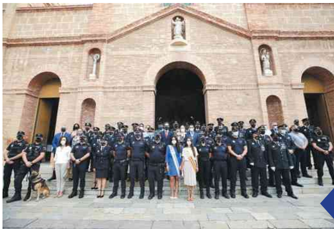
Gran parte de los asistentes a la misa que se ofició en la Iglesia de la Inmaculada.