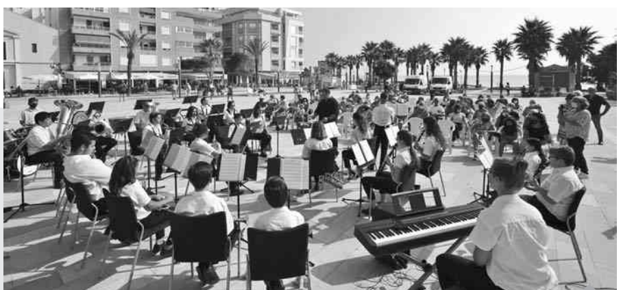
presencia de la imagen de la Virgen del Rosario, cantada por el Coro Nuevo Amanecer. Plaza de Encarnación Puchol.