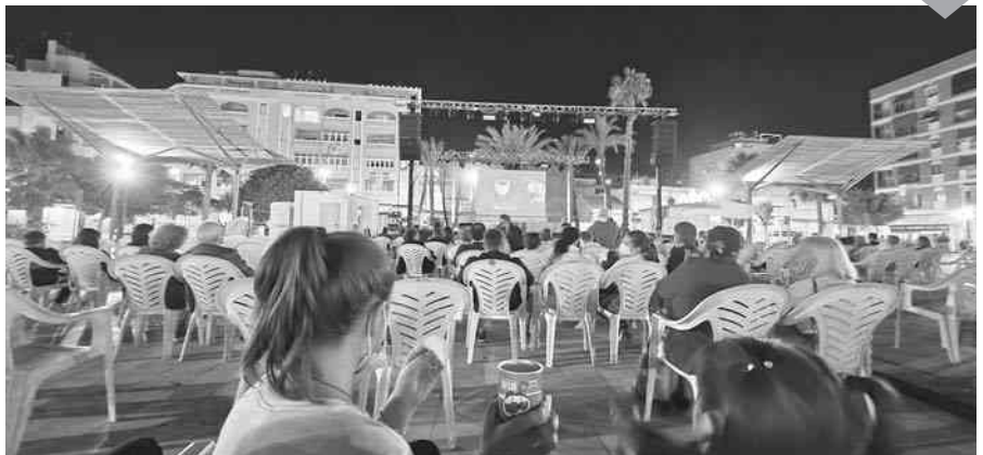
Se proyectó "Hotel Transilvania 3" dentro de la iniciativa "Cine en familia".