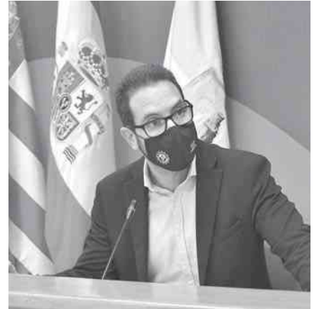
Como cada viernes el concejal secretario de la Junta de Gobierno Local trasladó los acuerdos de la misma a los medios de comunicación.

Por su parte se dio luz verde a tres convenios de cooperación educativa para la rea-