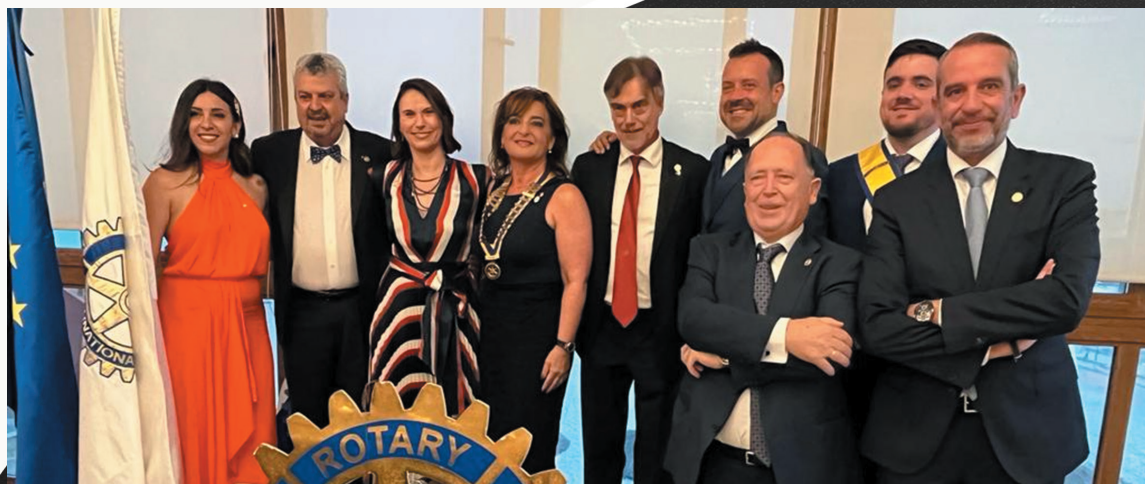
Los componentes de la nueva Junta Directiva.