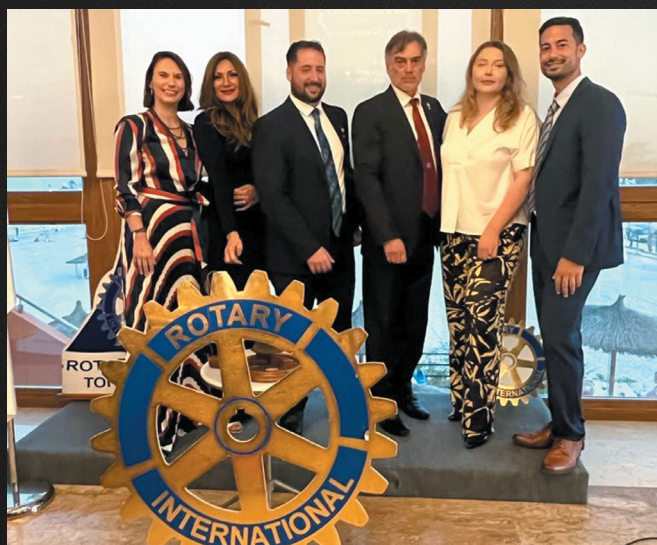
Distinguidos con la conmemoración "Paul Harris".