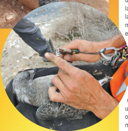
Los pollos de gaviota durante el anillamiento.

“ La colonia de Torrevieja se mantiene como una de las cinco más importantes de España ”