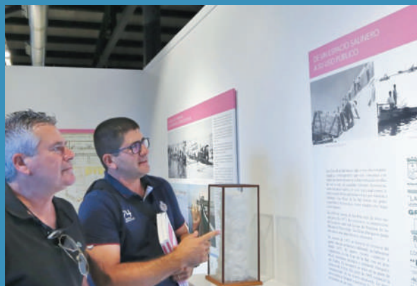
Momento de la visita de la exposición 'Las Eras de la Sal: origen de una ciudad' de las autoridades presentes.

Los asistentes podrán realizar un recorrido por el conjunto histórico de las Eras de la Sal a través de la evolución histórica de la explotación de la sal, los planos históricos del conjunto monumental, la cesión de 1998 al Ayuntamiento de Torrevieja para uso público, el estudio histórico y documental del conjunto de las Eras y la intervención arqueológica para su restauración y nuevo proyecto del Museo del Mar y la Sal.