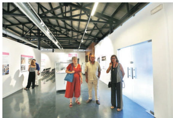
Representantes del IMC junto a algunos miembros de la comisión que han trabajado en la muestra y publicación.