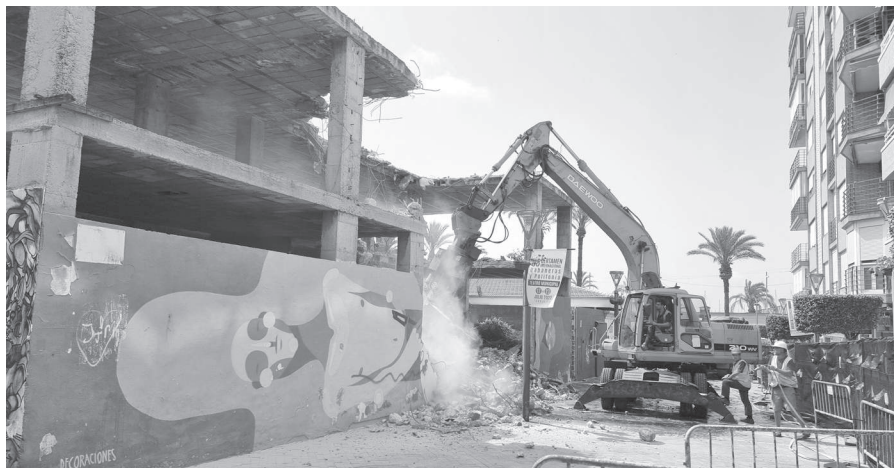
Durante esta semana se ha procedido al derribo total de la estructura que había en el lugar donde se levantará el edificio de la Universidad y la sede de Agamed.

euros, que se celebrarán los días 25 y 30 de septiembre, y 1, 2, 7, 8 y 9 de octubre. También se tramitaron dos lotes del expediente de fiestas en los barrios, el lote 1 adjudicado por 18.150 euros y el lote 3 por