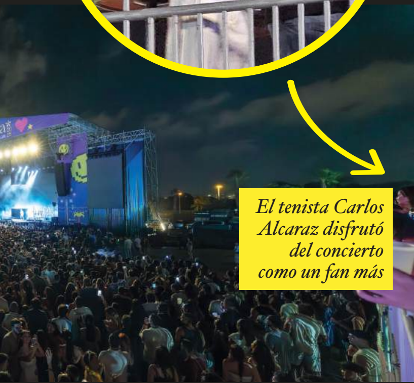
El tenista Carlos Alcaraz disfrutó del concierto como un fan más