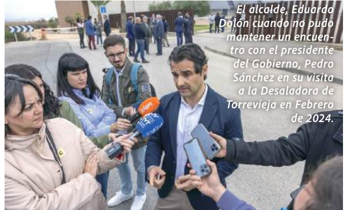
El alcalde, Eduardo Dolón cuando no pudo mantener un encuentro con el presidente del Gobierno, Pedro Sánchez en su visita a la Desaladora de Torrevieja en Febrero de 2024.

Los vecinos del Acequión y de la playa de Los Náufragos siguen reclamando las actuaciones de mejora comprometidas por el Gobierno de España tras la construcción de la actual desaladora.