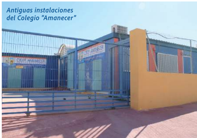
Antiguas instalaciones del Colegio "Amanecer"

cha durante el último trimestre de este año 2025.