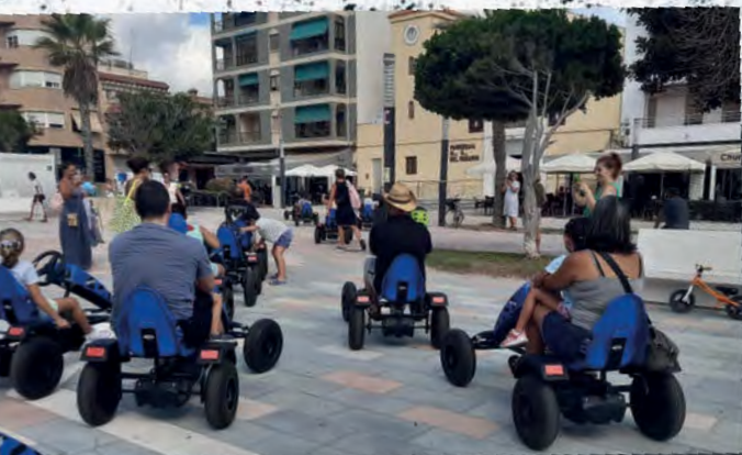
Un momento de la salida por el centro de La Mata desde la Plaza Encarnación Puchol.