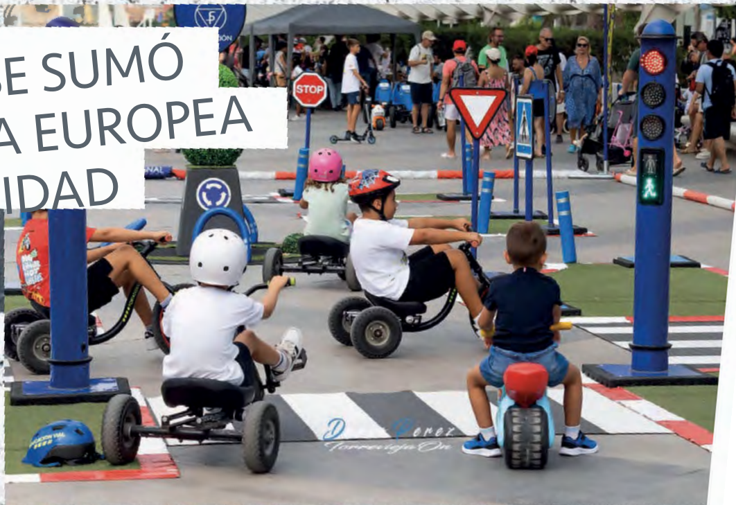
Parque de tráfico y salida en bicis en el Paseo Vista Alegre