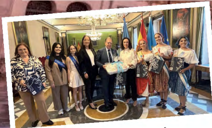
Recepción oficial del alcalde de Oviedo en el salón de sesiones del edificio consistorial.