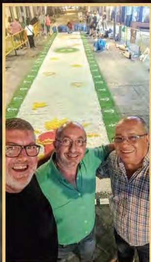
Durante los preparativos de la coronación se vivió un gran ambiente.

Durante toda la semana posterior a la coronación la Virgen de la Esperanza y de la Paz ha registrado centenares de visitas y prácticamente no ha estado sola en ninguno de los momentos mientras ha permanecido abierto el templo.