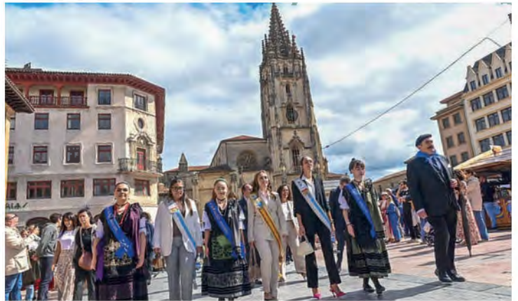
Imágenes del Día de San Mateo en Oviedo. La corte salinera con las reinas de las fiestas e imágenes de la presidencia en la Misa Mayor en la catedral.