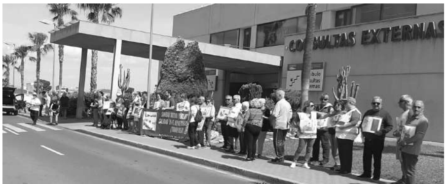
Momento de la performance reivindicativa de la plataforma por la sanidad pública

na todo el hospital y se hace más ostensible en el servicio de Urgencias que, según una encuesta promovida por esta entidad, es el peor valorado por los usuarios, debido, entre otras cuestiones, a las restricciones que impone la falta de camas en planta". Con todo, añade, "la mayor ocupación de camas hospitalarias se hace vía Urgencias, lo cual implica una demora de tratamientos e intervenciones de las consultas programadas".