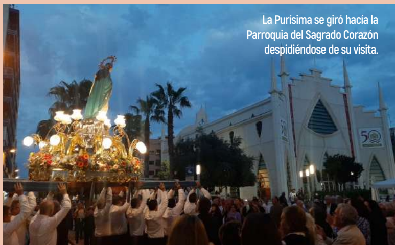
La Purísima se giró hacia la Parroquia del Sagrado Corazón despidiéndose de su visita.