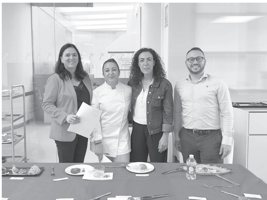
Los miembros del jurado evaluaron en el CdT todas las croquetas participantes.

Los 13 establecimientos asociados que participan en esta edición, que se celebrará del 15 al 21 de mayo, expusieron en el CdT las croquetas que van a ofrecer en este evento a un precio de 3 euros con bebida incluida.