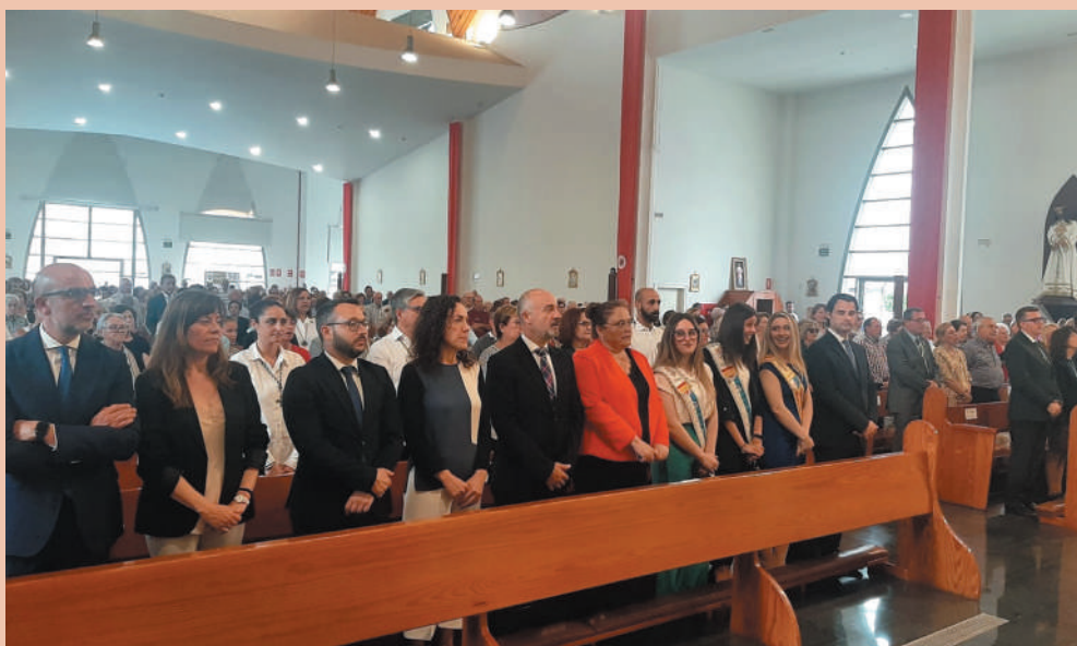
Representación municipal en la misa vespertina previo al regreso de La Purísima a su parroquia.