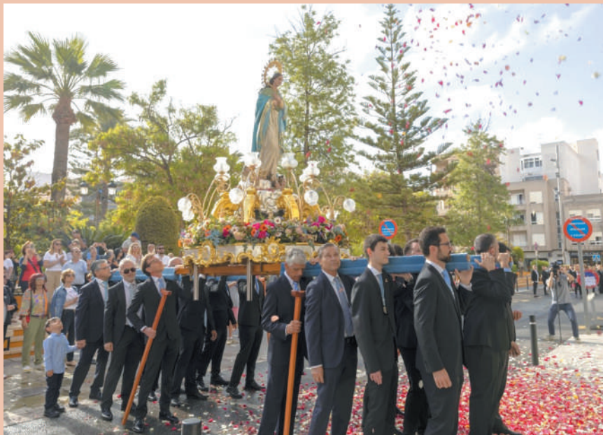
La Purísima saludó a la ciudad volviéndose hacia el edificio del Ayuntamiento y recibió una bonita petalada de flores organizada por la Concejalía de Fiestas.