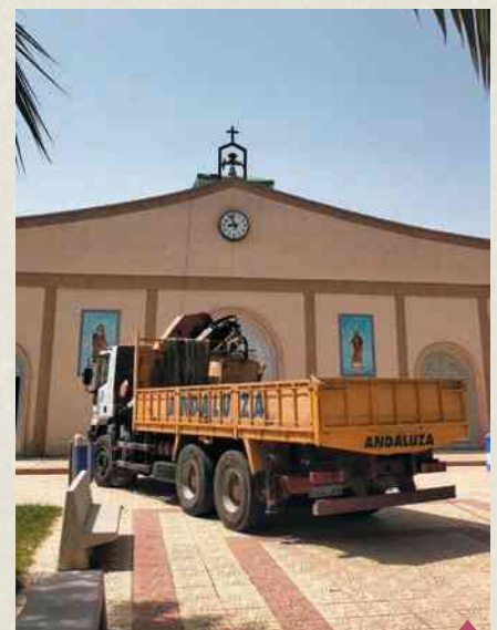
La nueva campana de la Parroquia sonó por primera vez en día de San Roque.