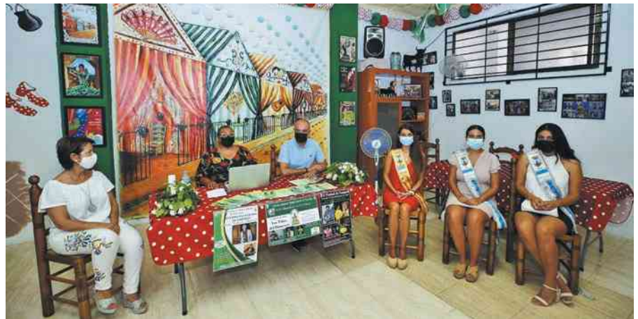
Foto de familia del homenaje a las Ong's locales.