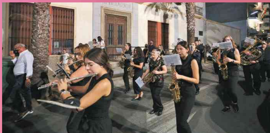
Los Salerosos han recuperado durante el festival los tradicionales pasacalles.