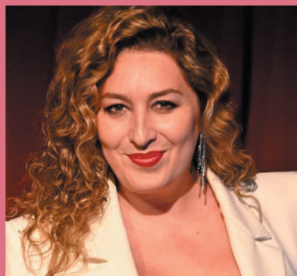
Estrella Morente 9 de junio Teatro Municipal

Monologuista Ángel Martín. 11 de junio. Teatro Municipal.