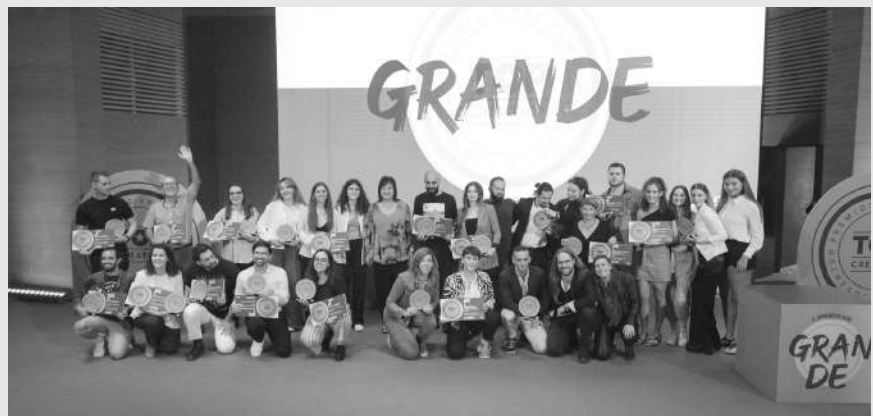
Los premiados del pasado año.