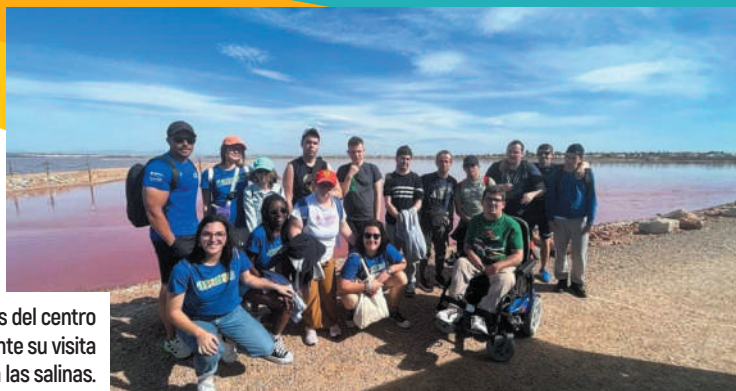
Los alumnos del centro EACO durante su visita guiada a las salinas.

Días atrás, se iluminó la Torre del Moro de azul, se celebró una jornada de convivencia de APANEE en el Área Recreativa 'José Eduardo Gil Rebollo' y se colocó un lazo azul y un corazón con un puzzle en el jardín entre los paseos Vista Alegre y de la Libertad. Asimismo, los alumnos del centro EACO visitaron las salinas y los usuarios de APANEE participaron en la XI Fiesta del Motor Clásico de Guardamar del Segura, con un sorteo solidario organizado por Rotary Club de la localidad.