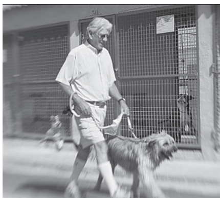
Uno de los voluntarios paseando a uno de los animales que están alojados en el Albergue Municipal en la actualidad.

El proyecto del nuevo Albergue Municipal de Animales, que se efectuará en el mismo