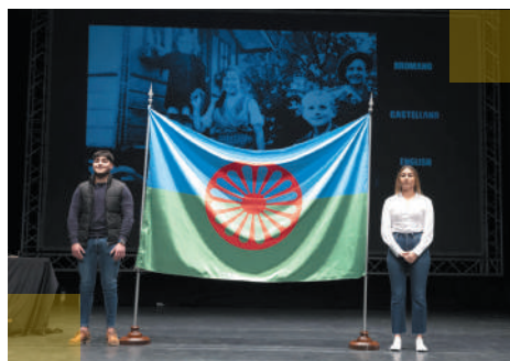
Momento del homenaje a la bandera con la interpretación de himnos.