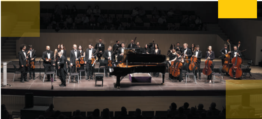
La OST y cuatro pianistas solistas protagonizaron este concierto extraordinario de estreno del piano de gran cola.