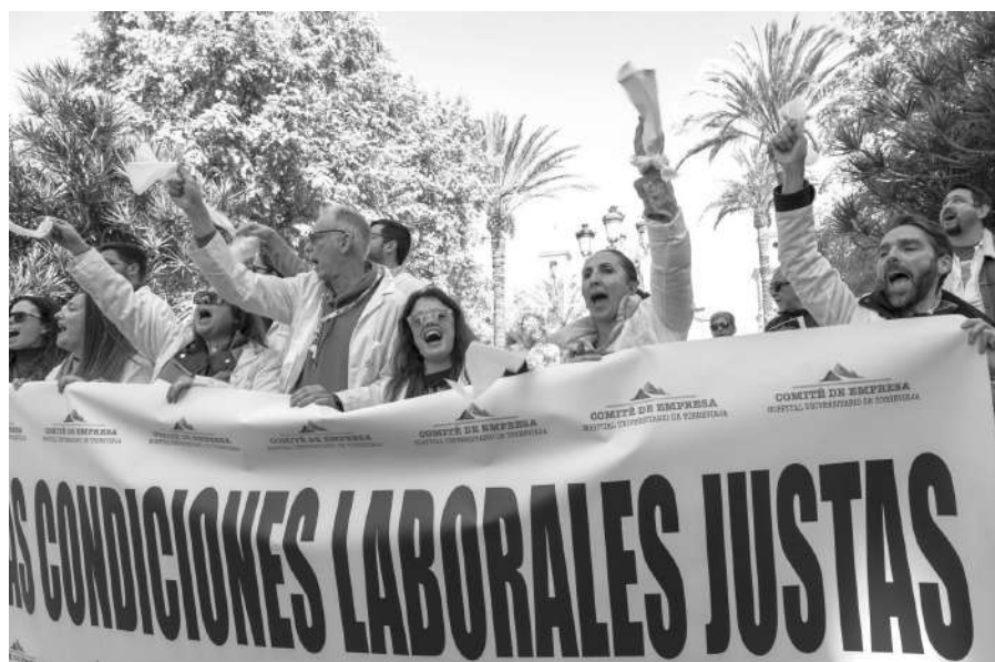
Foto de archivo de la manifestación del pasado mes de marzo

En otro orden de cosas, el próximo martes, 18 de abril, será considerado festivo, a efectos de apertura de centros de salud, en la zona básica de la ciudad de Torrevieja (centros de salud y Hospital). Los pacientes serán atendidos en los Puntos de Atención Continuada (PAC) en horario de 8:00 a 8:00 horas.