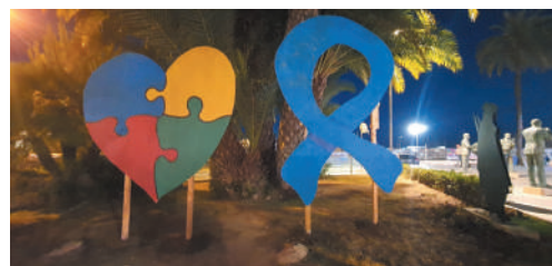
Se colocó un lazo azul y un corazón con un puzzle junto al Paseo Vista Alegre.