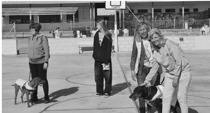
Momento de la visita al colegio Nuestra Señora del Rosario.

En esta primera visita a un centro escolar de Torrevieja dieron a conocer a los alumnos y profesores el trabajo que se desarrolla en el Albergue y, sobre todo, la importante labor que lleva a cabo el voluntariado. También se trasladó a los alumnos y alumnas las rutinas de buen tratamiento a los animales y se destacó la importancia de