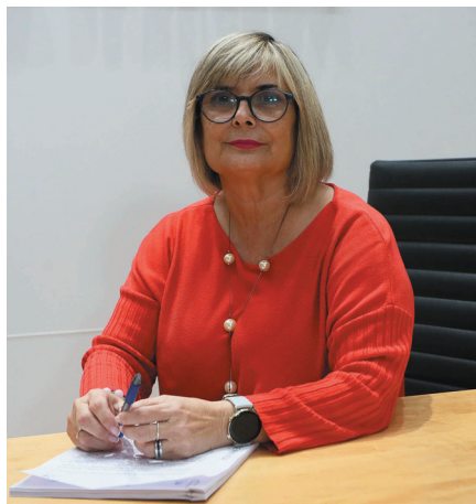
Loreto Serrano Diputada de Bienestar Social, Igualdad, Juventud, Cooperación y Voluntariado.

El plazo de presentación de trabajos ya está abierto y finalizará el próximo 30 de septiembre. Las personas que deseen obtener más información sobre estos premios, que llegan a su 21ª edición, pueden hacerlo a través del enlace https://n9.cl/wi8y0 o en el Área de Juventud de la Diputación de Alicante. Los participantes deberán tener entre 14 y 30 años (excepto en la categoría de Iniciativa Empresarial, donde la edad de los aspirantes deberá ser de 16 a 30 años).