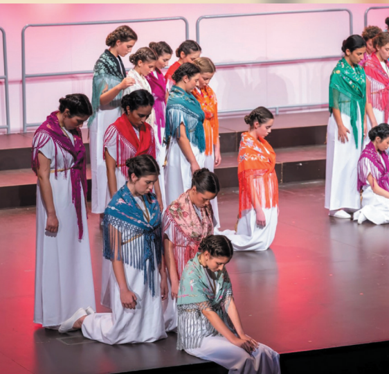
Un momento de la actuación de la coral sevillana "Entreolivos". Sus componentes hicieron un guiño a la Feria de Abril que terminaba ese mismo día.

El broche final a la gran jornada coral lo puso la interpretación conjunta por todos los integrantes de los coros participantes, de la habanera obligada, "Habanera de Sal" con la dirección del filipino, Enmanuel Ramos II, como vencedor de este 29º certamen.