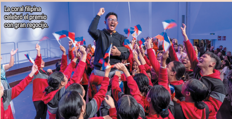
La coral filipina celebró el premio con gran regocijo.

Todos los coros participantes dejaron actuaciones sensacionales, con lo que el certamen puede decirse que tuvo una calidad muy marcada y alta. En es-