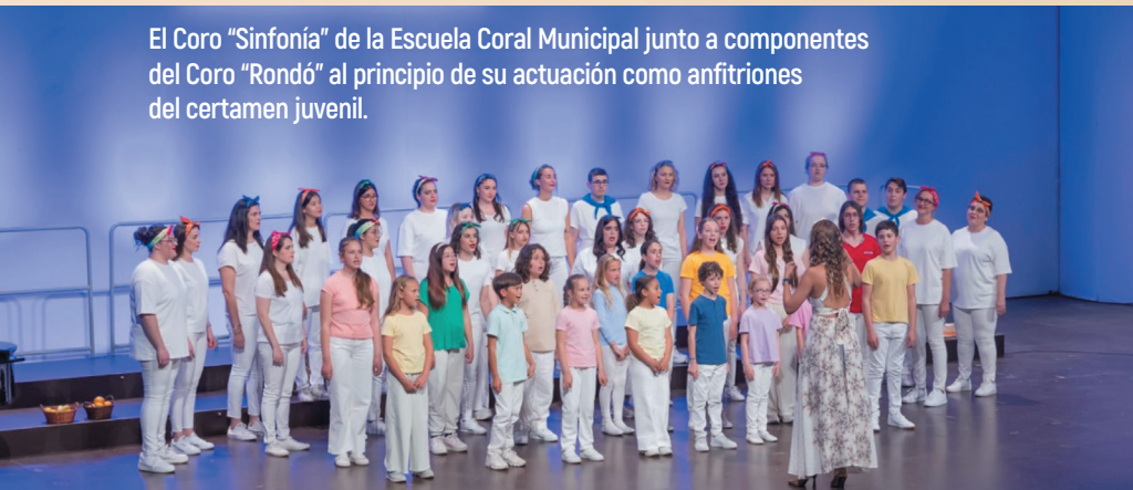
El Coro "Sinfonía" de la Escuela Coral Municipal junto a componentes del Coro "Rondó" al principio de su actuación como anfitriones del certamen juvenil.