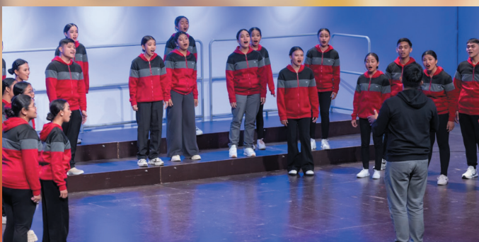
El Coro "Las Veredas" de Madrid ganó el segundo premio.