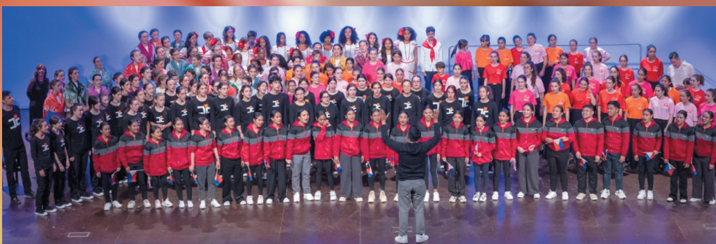
El coro filipino de Baao fue el indiscutible primer premio de este 29º certamen.