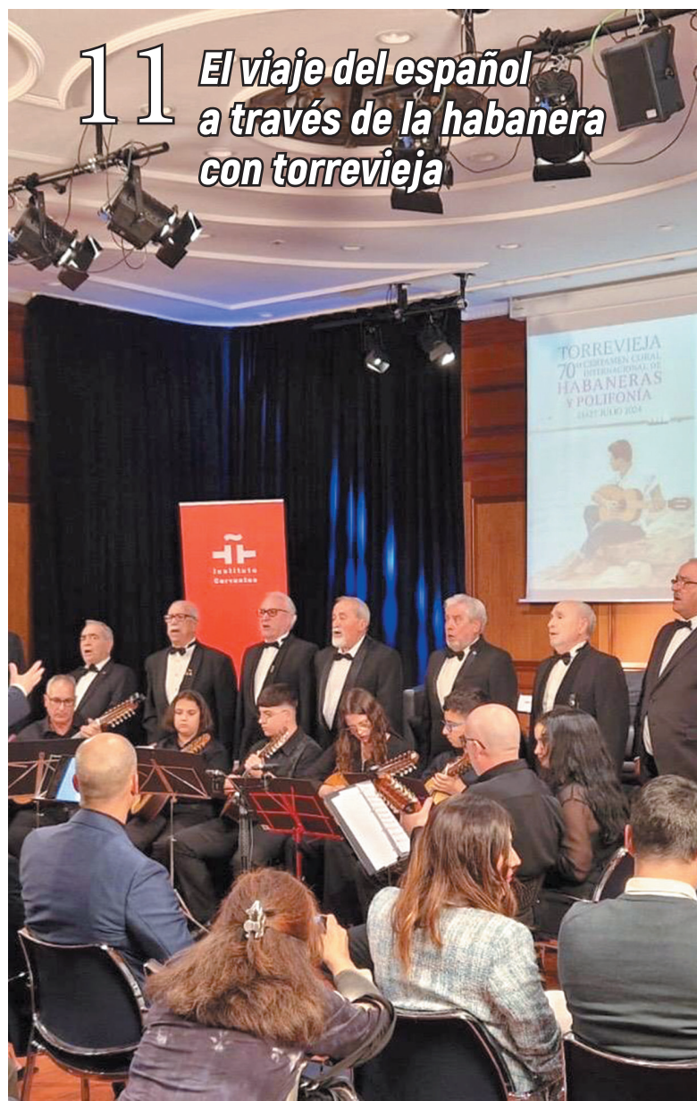
11 El viaje del español a través de la habanera con torrevieja