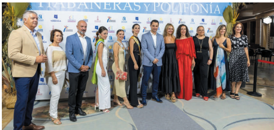
Recepción a la Consellera de Turismo, Nuria Montes.

dando sorprendido de altísimo nivel de esta edición, hasta el punto de haberse emocionado al escuchar precisamente una habanera que llevaba por título "Volver a Torreveija".