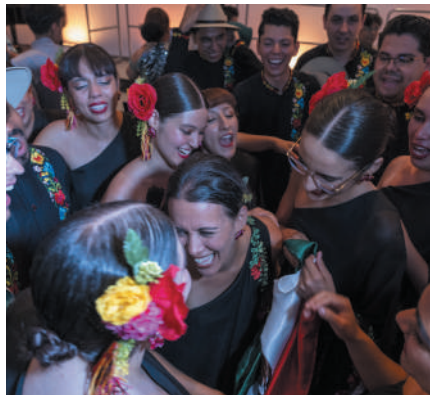
La coral mexicana celebrando su primer premio de habanera.