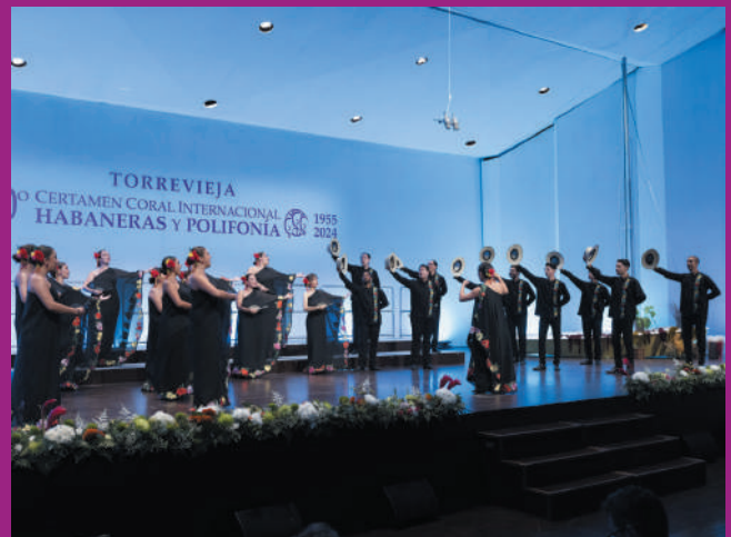
El coro mexicano de Jalisco ganador del primer premio de Habaneras.