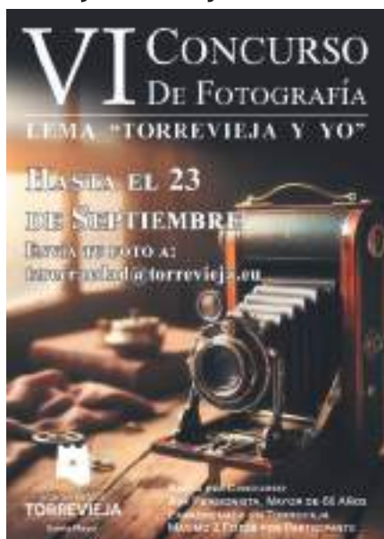
Cartel anunciador del VI Concurso de Fotografía 'Torrevejea y Yo', organizado por el Ayuntamiento de Torrevejea para homenajear a nuestros mayores.