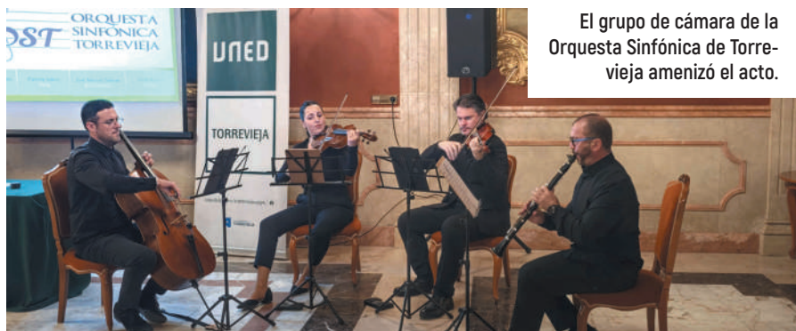
El grupo de cámara de la Orquesta Sinfónica de Torreveija amenizó el acto.