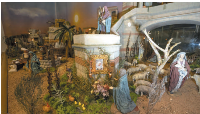
El nacimiento contiene también algunas alegorías referentes a conocidas habaneras y a la patrona de la ciudad