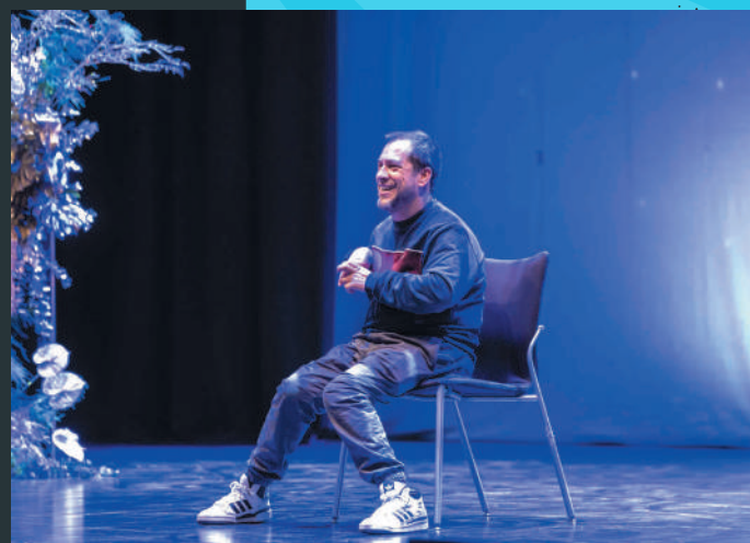
'El Langui' protagonizó el momento más esperado de la Gala 'Supercapaces'.