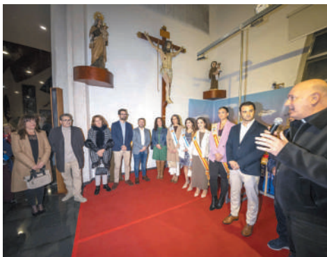
El belén del Sagrado Corazón en Torrevieja rinde homenaje a las víctimas de la DANA en Valencia