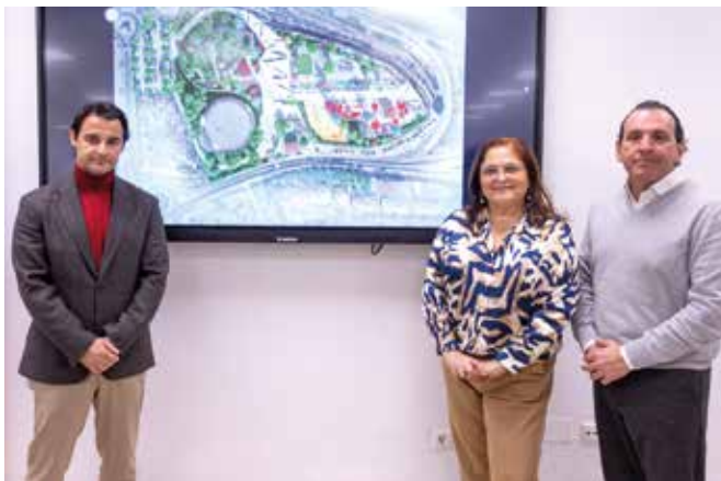
Un momento de la presentación del proyecto a finales del pasado mes de enero.

la estancia durante todo el año. El parque contará con una zona arbolada de picnic, dos grandes áreas de juegos infantiles, un mirador panorámico y una cafetería integrada en el entorno, concebida como punto de encuentro y descanso. Además, dispone de un par-