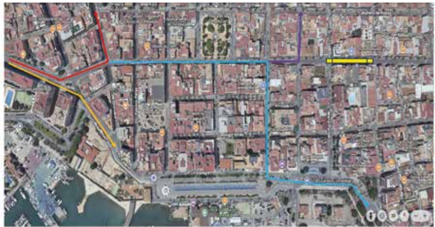
Desvío 1: Ramón Gallud con Orihuela (pre-desvío) Desvío 3: Ramón Gallud con Azorín Desvío 2: Gregorio Marañón con Faleña (pre-desvío) Desvío 4: Ramón Gallud con J. Chapaprieta Zona de corte: Ramón Gallud entre María Parodi y Rambla Juan Mateo

La Policía Local de Torrevieja ha informado de que la calle Ramón Gallud permanecerá cortada al tráfico hasta antes de Semana Santa debido a las obras pluviales que se están ejecutando en esta vía principal. Para garantizar la seguridad y reducir las afecciones, se ha instalado señalización luminosa de "Calle cortada" en la intersección con la calle Orihuela, además de prohibir el acceso a vehículos de más de 3.500 kilos. También se han habilitado desvíos alternativos por Paseos, Puerto y Salida Ciudad desde distintos puntos estratégicos. Se permite el giro a la izquierda desde la calle Azorín hacia el Paseo Vistalegre con un carril específico para mejorar la fluidez. Asimismo, se señala un desvío provisional hacia la zona norte. Las paradas escolares se trasladan temporalmente a nuevas ubicaciones. Se recomienda respetar la señalización y extremar la precaución.