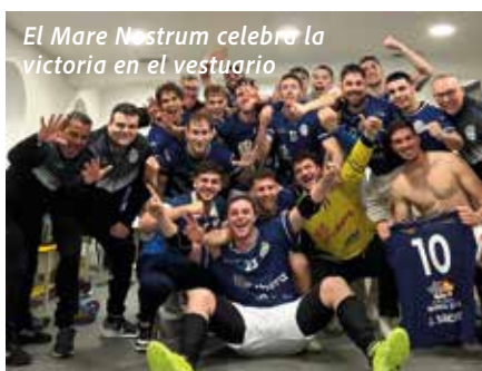
El Mare Nostrum celebra la victoria en el vestuario

RAFA BALLESTER. El Club Balonmano Mare Nostrum Torrevieja terminaba su participación en la temporada 2025/2026 visitando la casa del Club Balonmano Algemesis, ante el que perdía por 37 - 31 en un partido que servía para cerrar de manera definitiva este curso. El partido celebrado en el Pabellón 9 de octubre de Algemesis se disputaba en horario unificado a las 19:00h, coincidiendo con el resto de partidos de la 1ª Nacional ante la posible variación de posiciones en las partes alta y baja de la tabla. El conjunto valenciano era uno de ellos. Dependían de sí mismos para la perma-