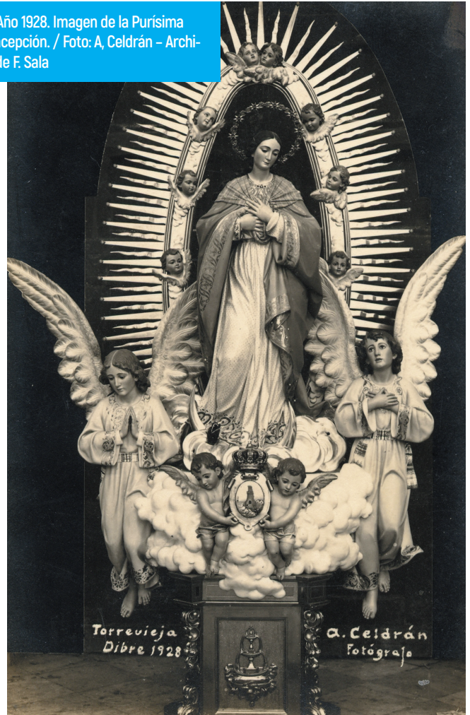
3.- Año 1928. Recordatorio de la inauguración del camarín de la Purísima.