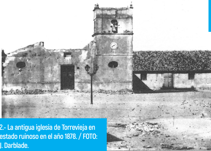
2.- La antigua iglesia de Torrevieja en estado ruinoso en el año 1878.