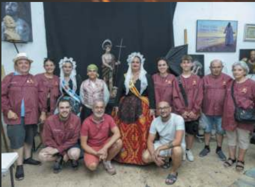
IMAGEN DE SAN JUAN BAUTISTA

En la mañana del día de San Juan la comisión acudió a visitar la imagen al taller del escultor, con acompañamiento de la música festera de la charanga "Da Capo".