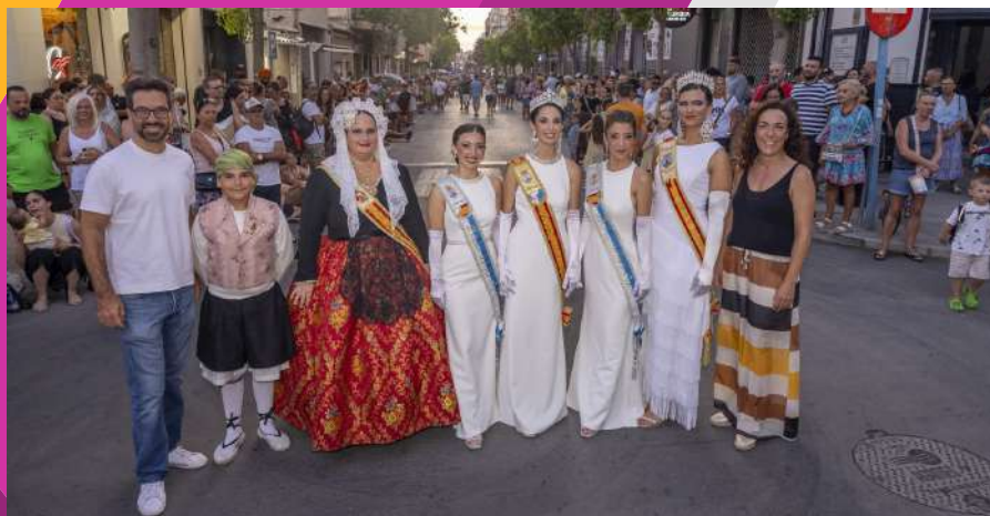
La Reina y Damas de la Sal cerraron la muestra festiva en la que brilló el carnaval torrevejense

Como en ocasiones anteriores se dispuso de Zona de bajas emisiones desde el inicio del desfile en calle del Mar con Ramón Gallud, hasta la calle Moriones, así como zona para personas con movilidad de reducida y varias salidas de emergencia.