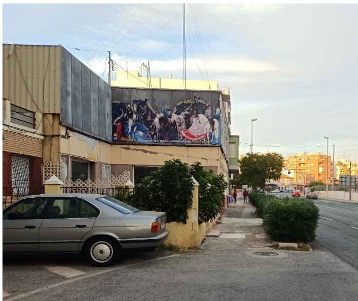
Vista cerramiento parcela

El cerramiento cuenta está compuesto por obra de fábrica y pilastras y valla metálica con puerta de acceso.