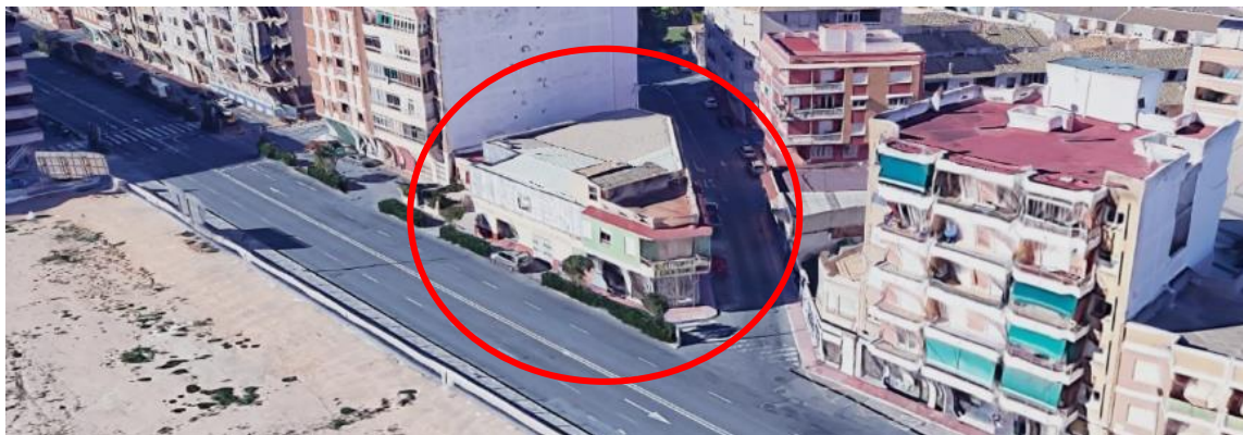
Detalle del inmueble cuyas alineaciones se reajustan con la MP nº 52