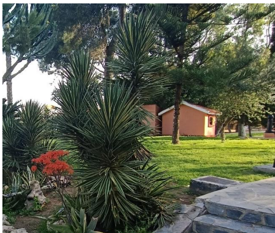
Ubicación edificación interior parque

Esta edificación se demolerá por ser incompatible con la nueva ordenación del parque.