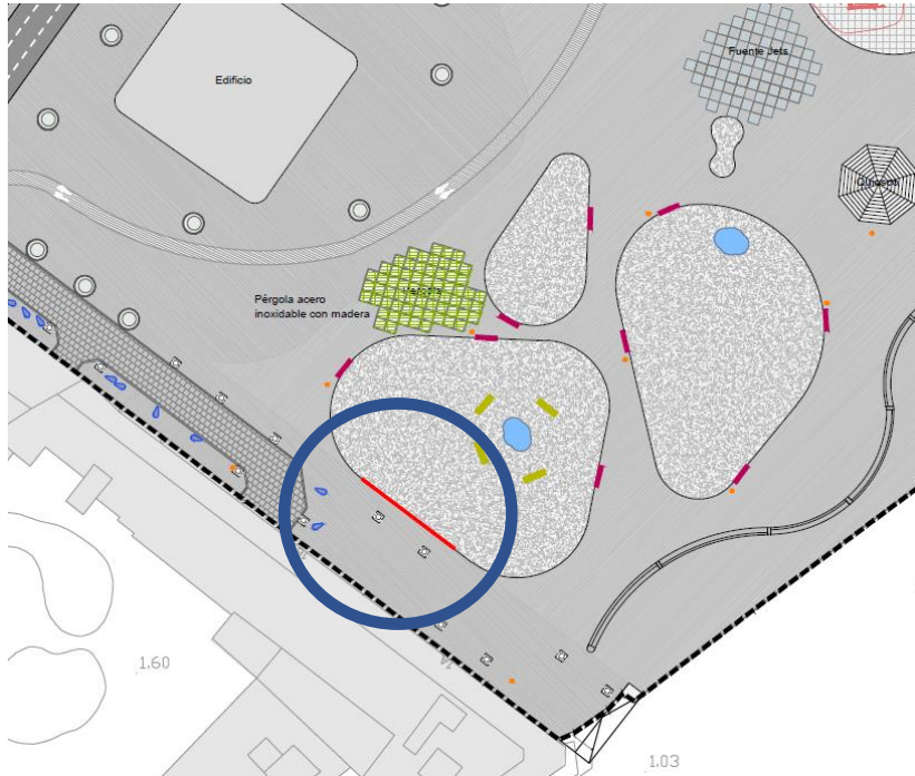
Ubicación tramo cerramiento a conservar del parque actual