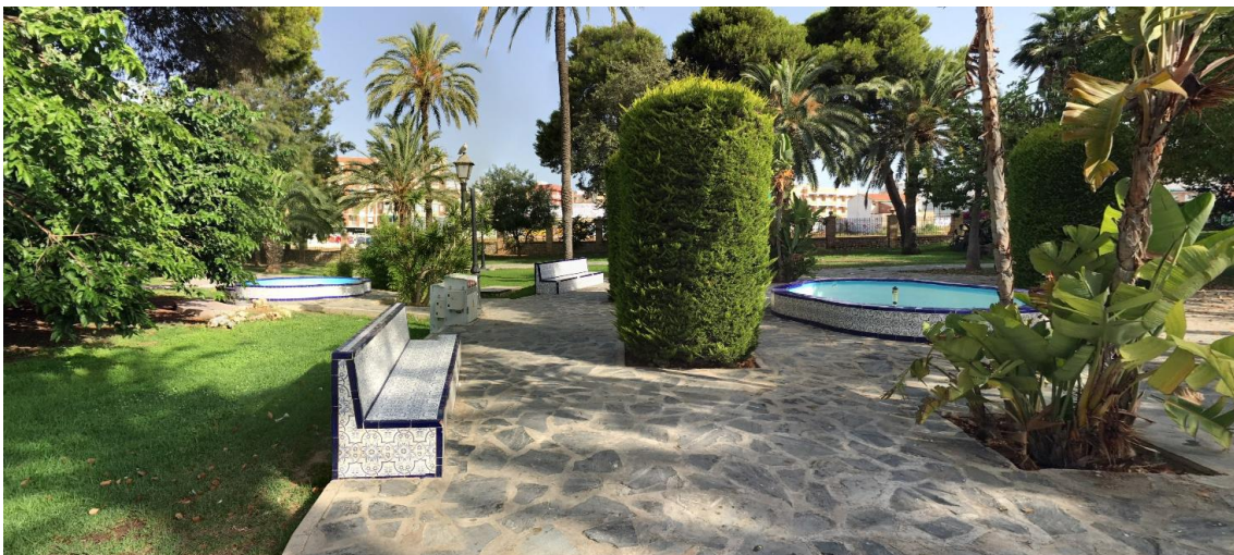
Vista elementos a rehabilitar y reubicar

La ubicación de estos elementos y ordenación del parque aprobada en el Estudio de Detalle son incompatibles, por lo que se prevén su rehabilitación y reubicación con los siguientes trabajos.