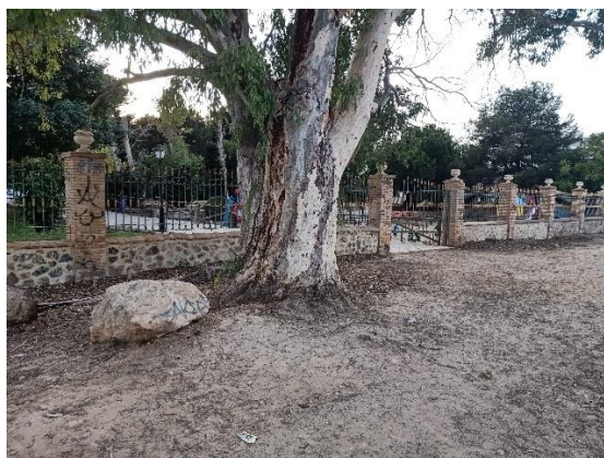
Vista cerramiento margen Acequión

Se demolerá todo el perímetro, a excepción de un tramo de la calle Doña Sinfrosa que se conservará en cumplimiento de lo indicado en la aprobación del Estudio de Detalle.