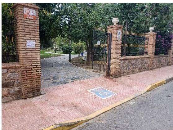
Vista cerramiento parque c/Doña Sinfrosa

Para una mejor interconexión e integración con el resto del ámbito urbano (avenida Gregorio Marañón y calle Doña Sinfrosa y con la playa del Acequión), se demolerá el cerramiento actual del parque, mejorándose la transversalidad de todo el entorno.