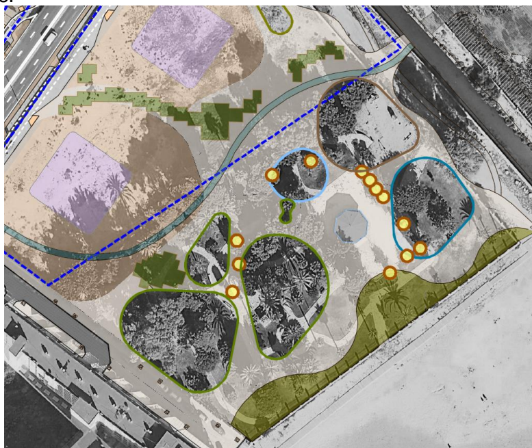
Ubicación árboles incompatibles con la nueva ordenación

Según se recoge en el Estudio de Detalle aprobado, existe una serie de 13 árboles que por su escasa relevancia y/o estado de preservación no se conservarán debido a que su ubicación es incompatible con la nueva ordenación. Todos estos elementos no son trasplantables.