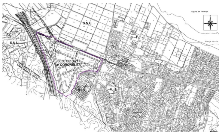
Situación en el ámbito urbano. Plan Parcial 'La Coronelita'.

En ese mismo Anexo II, se define como cuenca visual "c.2) Se entenderá como cuenca visual de la actuación el territorio desde el cual esta es visible, hasta una distancia máxima de 3.000 m, salvo excepción justificada por las características del territorio o si se trata de preservar vistas que afecten a recorridos escénicos o puntos singulares."