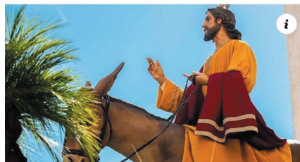
CONFERENCIAEPISCOPALES 2. Domingo de Ramos en la Pasión del Señor - Conferencia Episcopal Española

https://www.conferenciaepiscopal.es/creemos/semana-santa/domingo-de-ramos