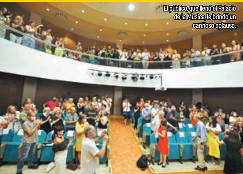
El público, que llenó el Palacio de la Música, le brindó un cariñoso aplauso.