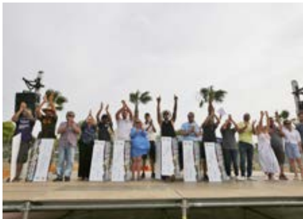
Foto de familia de los premiados en el concurso nacional de grafiti.

Lleva por título "REF:SM0002. Conspiración en Chipre"