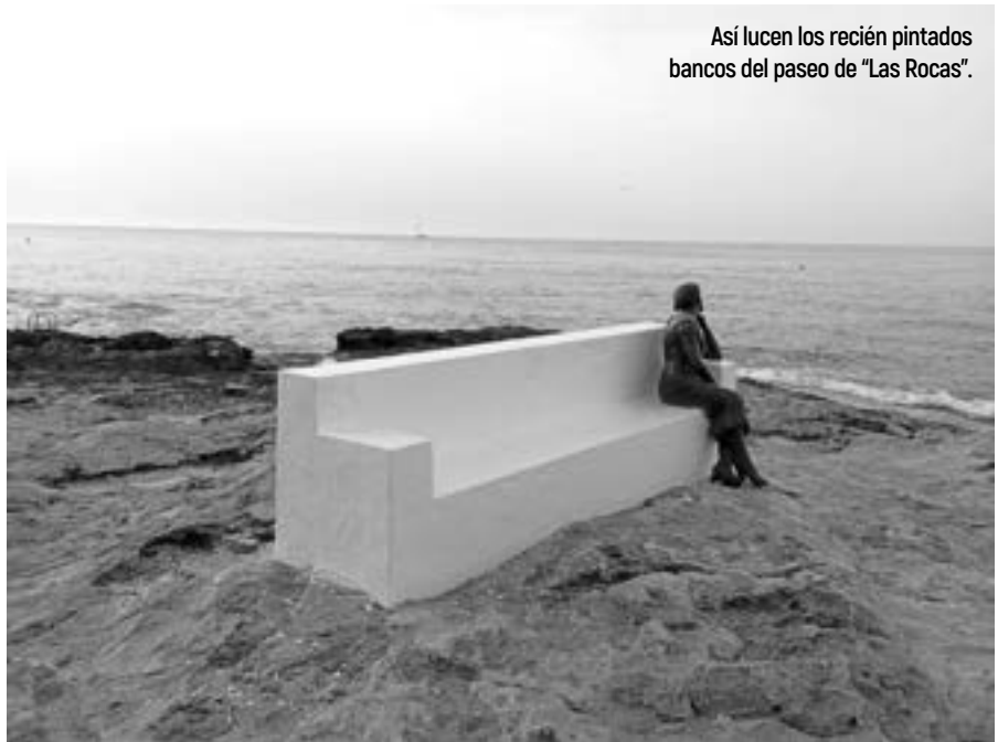
Así lucen los recién pintados bancos del paseo de “Las Rocas”.

La barandilla de protección de la calle Orihuela sobre la N-332 ya está acondicionada.