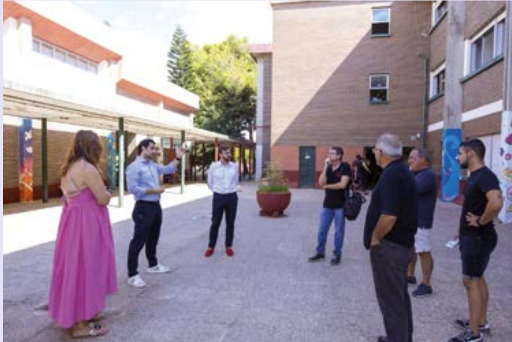
Un instante de la visita realizada al IES Las Lagunas.

13.294 escolares lo tenían todo preparado para una vuelta al cole deseada por unos y odiada por otros. Cargados de ilusión, con su nuevo material escolar, y deseosos de ponerse al día con sus compañeros, veíamos a los niños y niñas en las puertas de los colegios torreveses. Algunos lloros también fueron protagonistas, especialmente en los que comenzaban, por primera vez, el colegio. Aunque los alumnos de primero de infantil tienen su periodo de adaptación, el resto de escolares ha comenzado en su horario habitual, listos para escuchar y aprender de sus maestros y profesores.