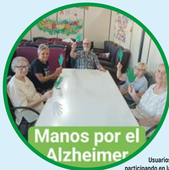
Usuarios participando en la campaña 'Manos por el Alzheimer'

A su finalización actuará la Asociación Cultural Andaluza. La jornada continuará a las 13:00 horas con una convivencia y paella para comer.