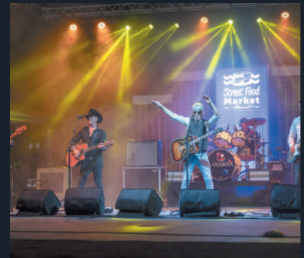
Momento de algunas de las actuaciones musicales.