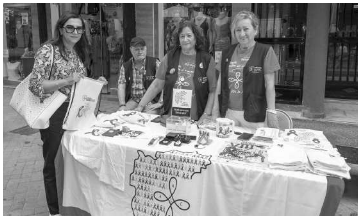
Mesa informativa de la Asociación Alicante para la Lucha contra el Cáncer.