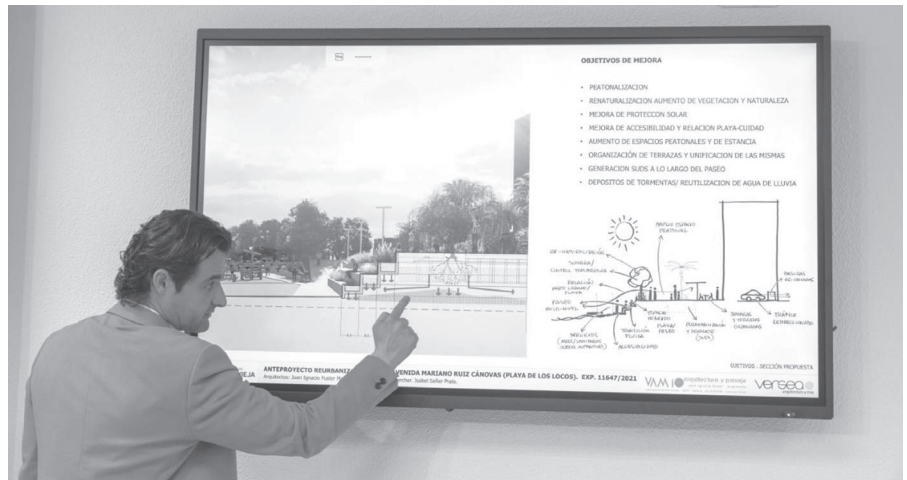
El pasado mes de abril el alcalde dio a conocer los detalles del anteproyecto para la remodelación del paseo de la Playa de Los Locos.

Por otro lado, por el procedimiento de urgencia fue aprobado el pliego del contrato de producción, organización y realización de las fiestas patronales, previstas del 1 al 10 de diciembre, con el fin de «acortar plazos». Posteriormente, el 6 de octubre se dio luz verde a la contratación, memoria justificativa y pliegos del contrato, con un valor estimado de 154.133 euros. También se aprobó la contratación, memoria y pliegos del contrato de montaje, desmontaje, embalaje,