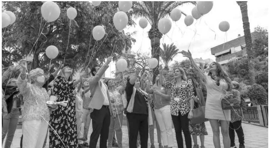
Momento de la suelta de globos y lectura del manifiesto en la Plaza de la Constitución.