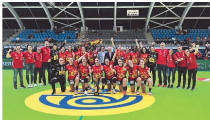
Las Guerreras en su visita a Torrevieja en noviembre de 2022.