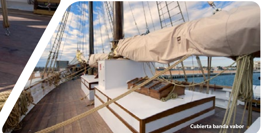
Cubierta banda vapor