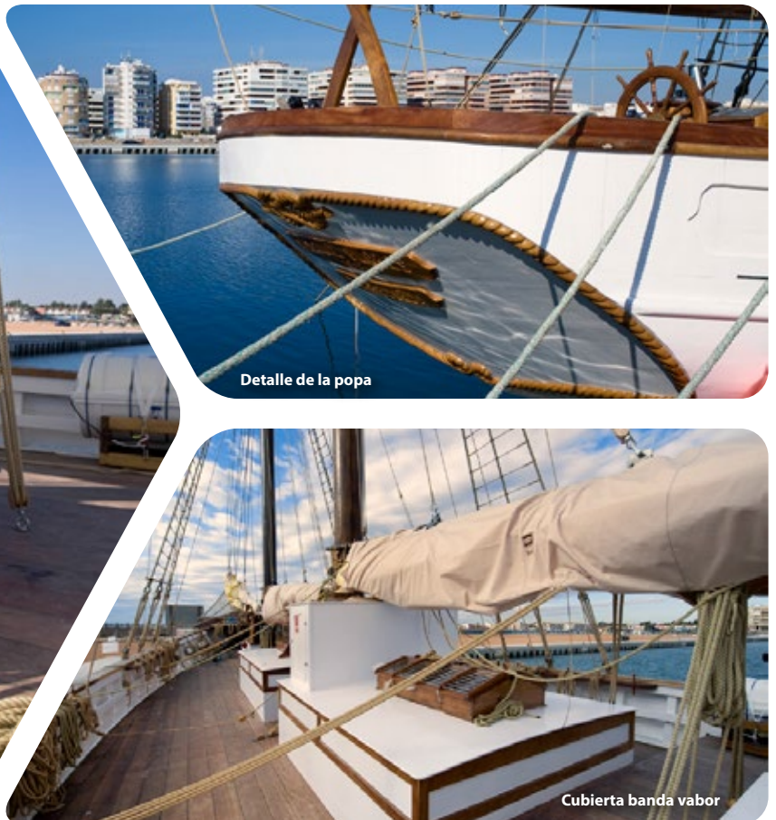
Detalle de la popa