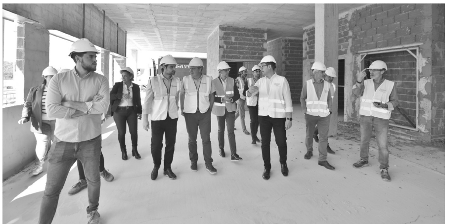
Después se trasladaron a las obras del colegio Amanecer para comprobar in situ el avance de los trabajos.