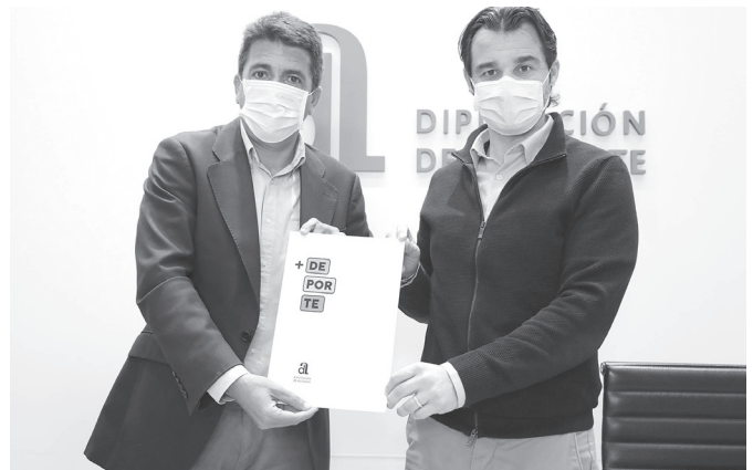
El presidente de la Diputación, Carlos Mazón muestra el presupuesto junto a Eduardo Dolón.

También aumenta su cuantía el programa de subvenciones a municipios para la Promoción Deportiva, que alcanza los 660.000 euros, la línea destinada a deportistas de élite, que crece más de un 14%