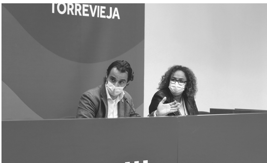
El alcalde, Eduardo Dolón junto a la concejal del Cuidado y Potenciación de la Imagen Urbana, Carmen Gómez Candel, durante la rueda de prensa en la que se dio a conocer la adjudicación del servicio de limpieza.

El acuerdo requería a la mercantil ACCIONA SERVICIOS URBANOS que, en el plazo