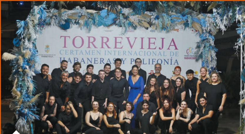
Coro Maestro Casanovas