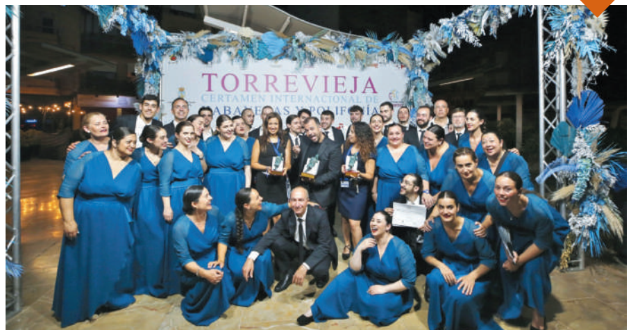
El Coro "Gaos" de A Coruña fue la agrupación española más laureada de esta edición del certamen.