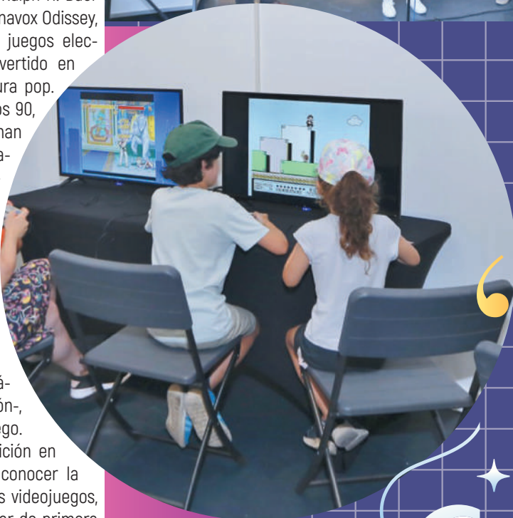
El público podrá disfrutar jugando a las consolas.

Se podrá visitar hasta el 30 de septiembre en la sala Vista Alegre