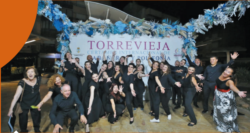
La Coral Francisco Vallejos en el photocal instalado en la plaza de Miguel Hernández