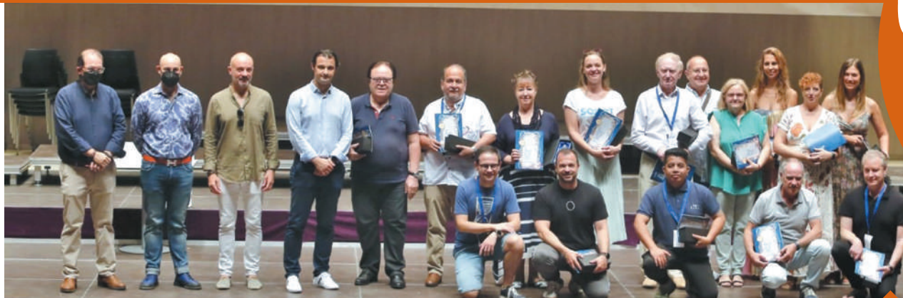
Instantes de la recepción ofrecida a los coros en el Auditorio Internacional.