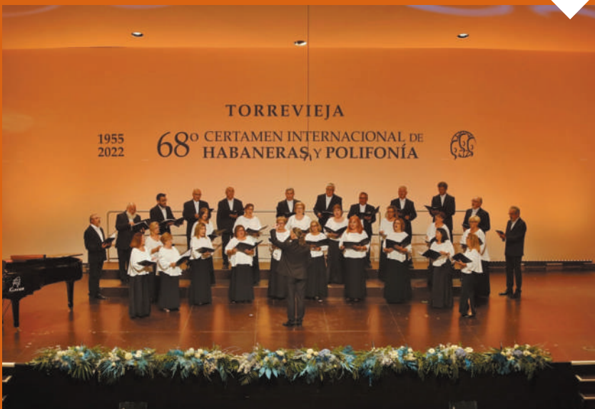
Agrupación Coral Manuel Barberá