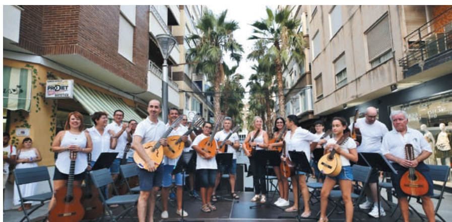
La Orquesta "Maestro Ricardo Lafuente" ofreció un recital de "Habaneras en la Calle" en la calle Concepción.