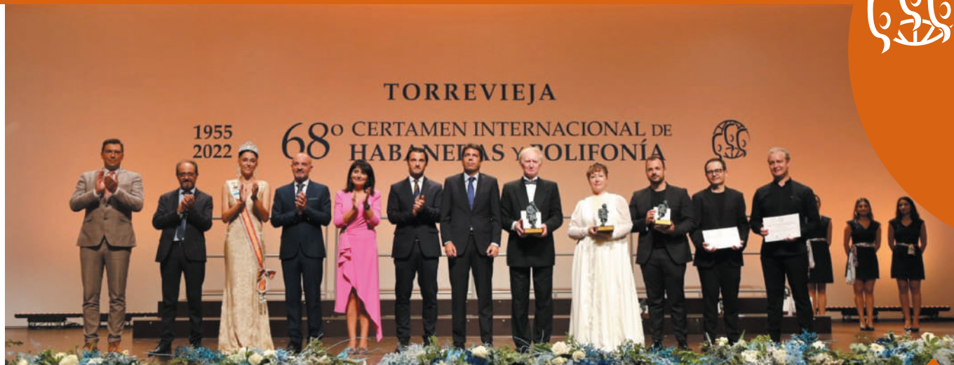
Foto conjunta de premiados y autoridades.

no ha podido estar en la gala por tener otros compromisos profesionales.