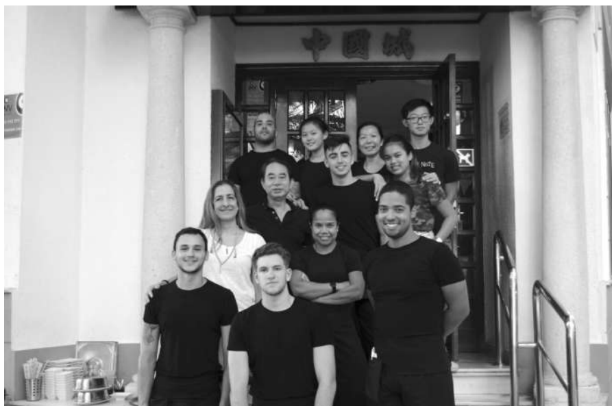
Plantilla del Restaurante Chinatown.

Los galardones se entregarán con motivo de la 47ª Cena de Hermandad de la Asociación de Empresarios de la Hostelería de Torrevieja y Comarca que, tendrá lugar el 27 de marzo.