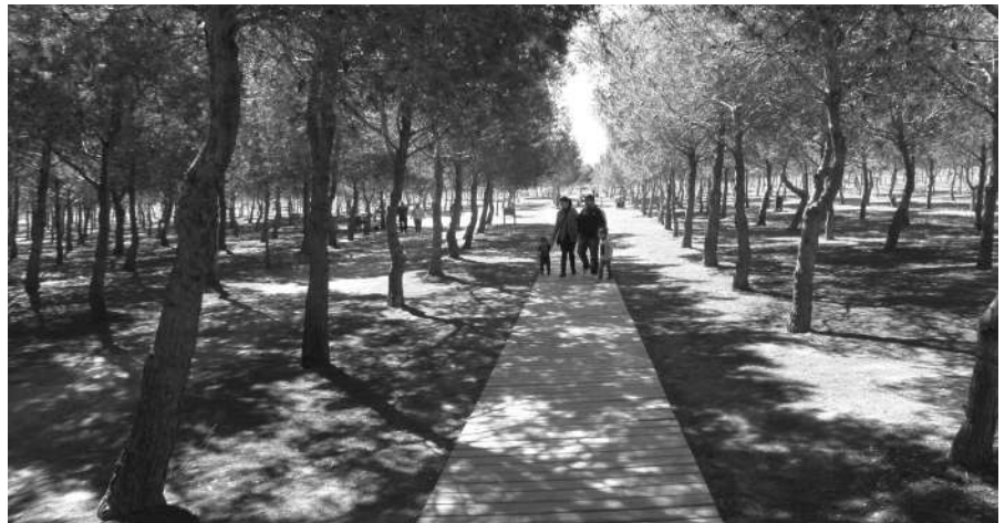
Área Recreativa Municipal 'José Eduardo Gil Rebollo' donde se celebrará la acampada.

El período de acampada será desde el 1 de abril hasta el 17 de abril, ambos inclusive. Dicha autorización deberá realizarse, mediante instancia general, en la sede