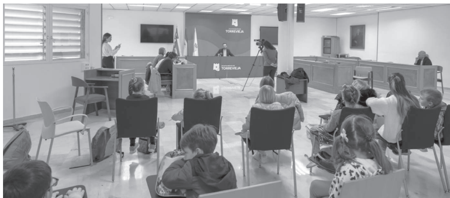
Los niños siguen con atención la rueda de prensa de Federico Alarcón.

En otro orden de asuntos se dio cuenta de que ha quedado desierto el lote 1 del expediente de suministro de alimentos y productos de higiene de primera necesidad para personas desfavorecidas. La empresa adjudicataria del lote 1 relativo a productos frescos se retira alegando imposibilidad de cumplirlo por el aumento de precios del mercado. Se archivaron además dos contratos relativos a la memoria técnica valorada para actuaciones del IES nº6 con el Plan Edificant en el Sector 20-La Hoya, ya que finalmente se hará en La Coronelita; y relativo a la revisión y actualización del inventario municipal de bienes y derechos del patrimonio del Ayuntamiento. Igualmente se tramitó invitación a una empresa en el contrato del servicio de explotación del bar-cafetería de las casas de tercera edad de San Pascual y Pedro Lorca para que presente la documentación en tiempo y forma.