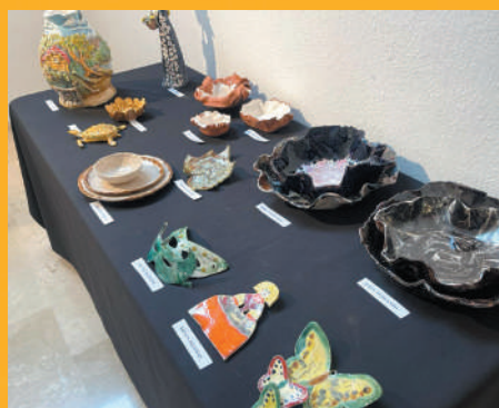
Muestra de algunas de las 300 piezas hechas a mano expuestas.