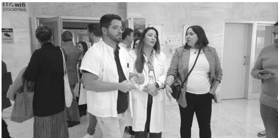
Miembros del comité de empresa valorando la reunión con el conseller.

Días atrás, la plataforma 'Sanidad Excelente' instó a la Generalitat Valenciana a una licitación pública para la colaboración público-privada en la gestión de la sanidad pública en el Departamento 22 de Salud de Torreveija. "Gracias a esa colaboración público-privada