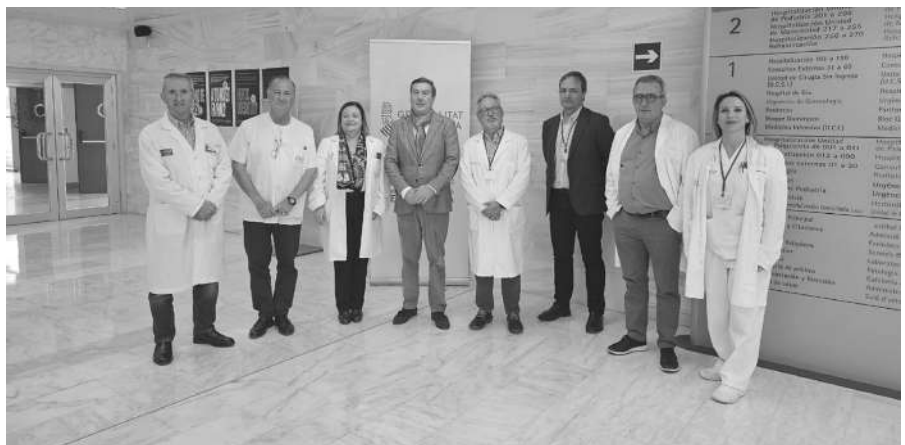
El conseller de Sanidad junto al gerente del departamento y equipo directivo.